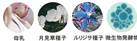
母乳 月見草種子 ルリジサ種子 微生物発酵物